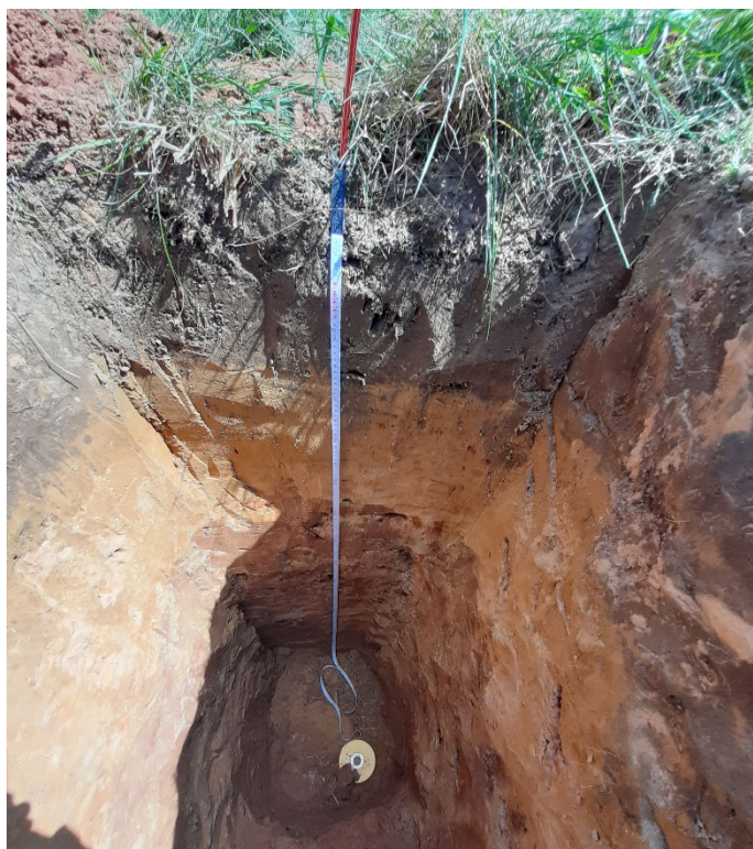
Известняковая плита на глубине 160 см