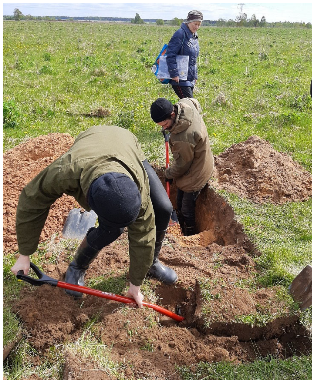
Начало закладки разреза