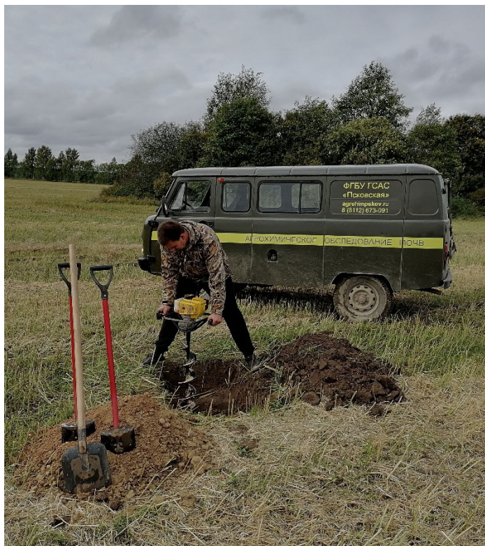
Для облегчения копки разрезов специалисты Учреждения применяли Бензобур